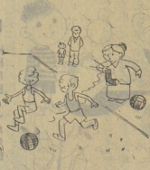
Рис. В. ШВАРЦА