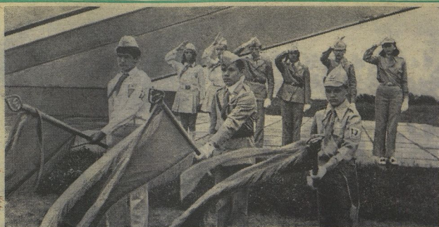
Взминулась в небо стела мемориального комплекса... Здесь, на высоте 112,0, насмерть стояли защитники города-героя Ленинграда. Символично, юнговское знамя — пионерский салют героям! ВЕСЕЛОМЫЙ ФИНАЛ «ЗАРНИЦЫ» ПРОДОЛЖАЕТСЯ. МАТЕРИАЛЫ НАШИХ СПЕЦИАЛЬНЫХ КОРРЕСПОНДЕНТОВ ЧИТАЙТЕ НА 2-й СТРАНИЦЕ.