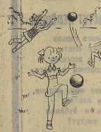
Пока мальчишки не выйдут...